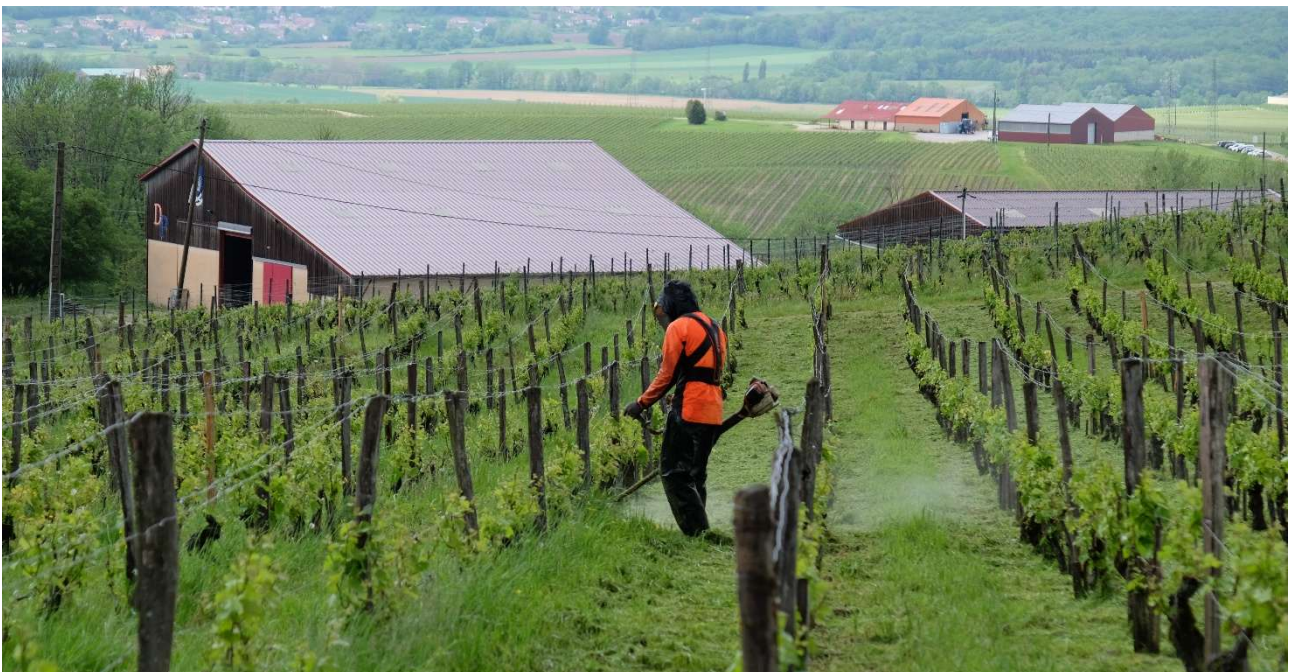
Unterstockarbeiten in den begrüneten Rebzeilen der Domaine de la Pinté.